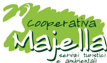
Cooperativa Majella www.cooperativamajella.it