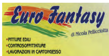
EURO FANTASY di Nicola Pellicciotta www.euro-fantasy.it