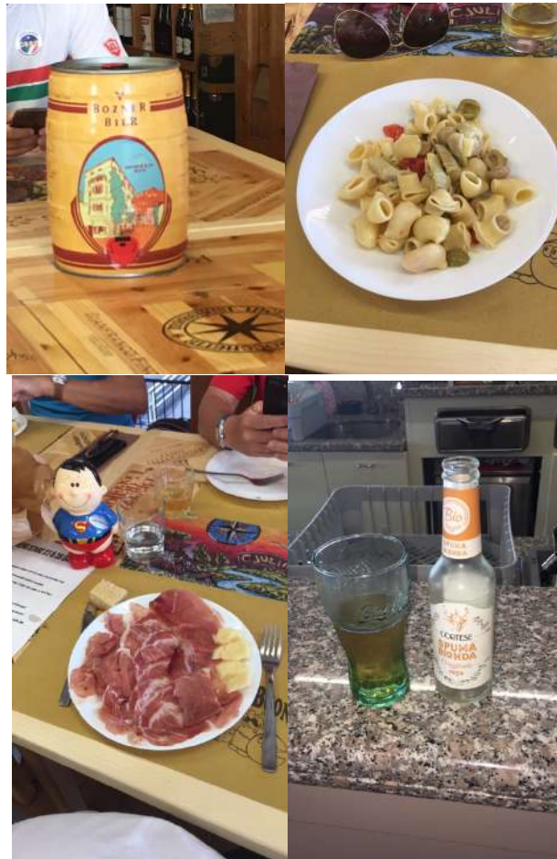
Alcune prelibatezze della club House

Location perfetta, struttura all'altezza della situazione e, cosa non indifferente, la straordinaria capacità culinaria dei gestori della club house. Dopo il dovere c'è sempre il piacere.