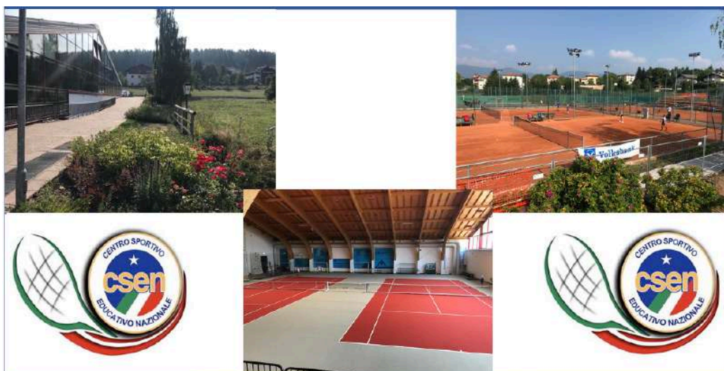
La Csen Tennis Arena di Cavareno

Il corso di Istruttore Nazionale si è tenuto il 27 e 28 giugno nella splendida località di Cavareno, presso la struttura simbolo della CSEN Trentino, la CSEN Arena.