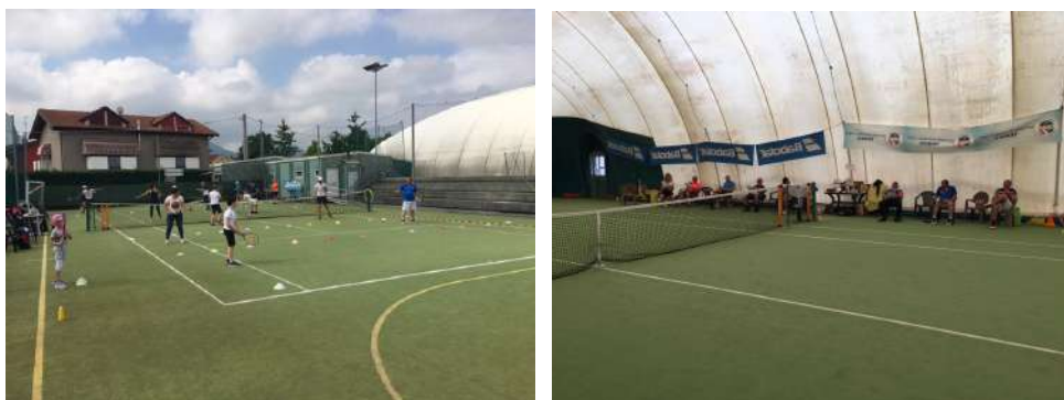
La giornata di insegnamento a Cervarese S. Croce

Il feedback da parte dei partecipanti è stato più che positivo, anche tenendo conto dei nuovi strumenti usati per fare la formazione, strumenti nuovi per gli allievi, ma anche per i formatori.