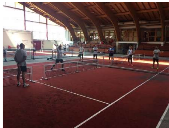
Gli aspiranti istruttori durante le sessioni pratiche

Il tutto, naturalmente, mantenendo le distanze di sicurezza e con il rispetto delle regole anti covid.