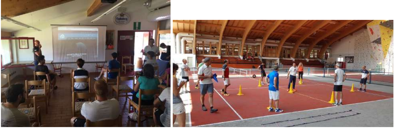
I corsisti durante la prima giornata

La domenica, invece, si e' dedicata alla verifica di quello che gli allievi avevano imparato nel corso regionale e nella prima giornata del nazionale, con la preparazione di una lezione fatta a dei bambini messi a disposizione dal circolo. A corredo della lezione ai bambini c'e' stata una sessione di spiegazione di Tennis on the Beat da parte dell'ideatore di questa metodologia e formatore della CSEN, Fabio Valentini, in cui si fondono musica e tennis insieme, per far fruttare gli stimoli positivi che l'incedere musicale ha su colpi e loro efficacia